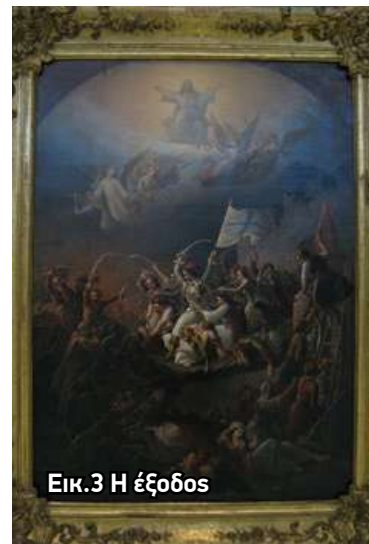
Εικ.3 Η έξοδος

Αν οι Ευρωπαίοι καλλιτέχνες είδαν το Μεσολόγγι ως σύμβολο ελευθερίας, οι Έλληνες ζωγράφοι το αντιμετώπισαν ως ζωντανή μνήμη του αγώνα. Κορυφαίος εκπρόσωπος