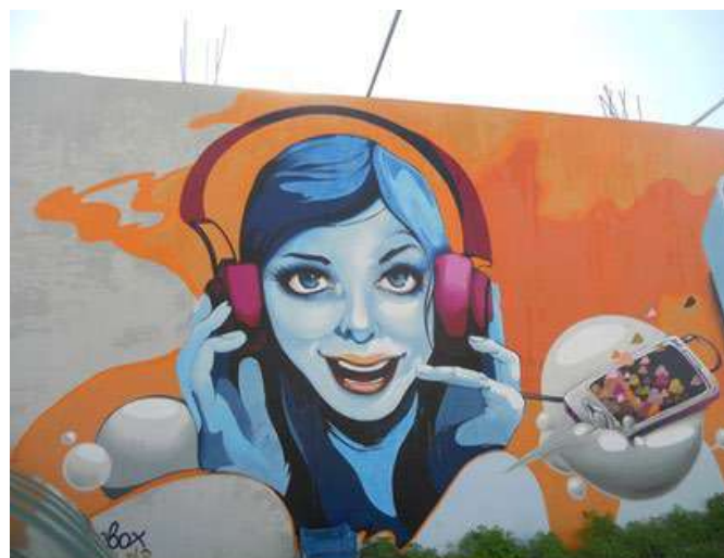
Η όραση της ψηλομύτας!

Στο πλούσιο δείπνο του ήθελε και ένα ωραίο, ζουμερό φρούτο. Το τακουνάτο ελκυστικό πορτοκάλι