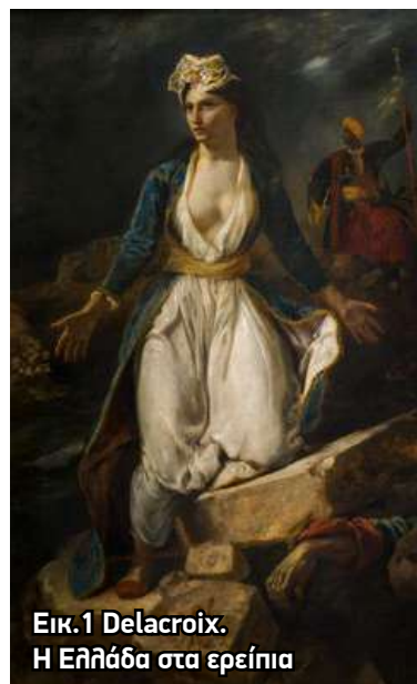
Εικ.1 Delacroix. Η Ελλάδα στα ερείπια

Σε ένα άλλο έργο του, γνωστό ως « Επεισόδιο του Ελληνικού Αγώ-