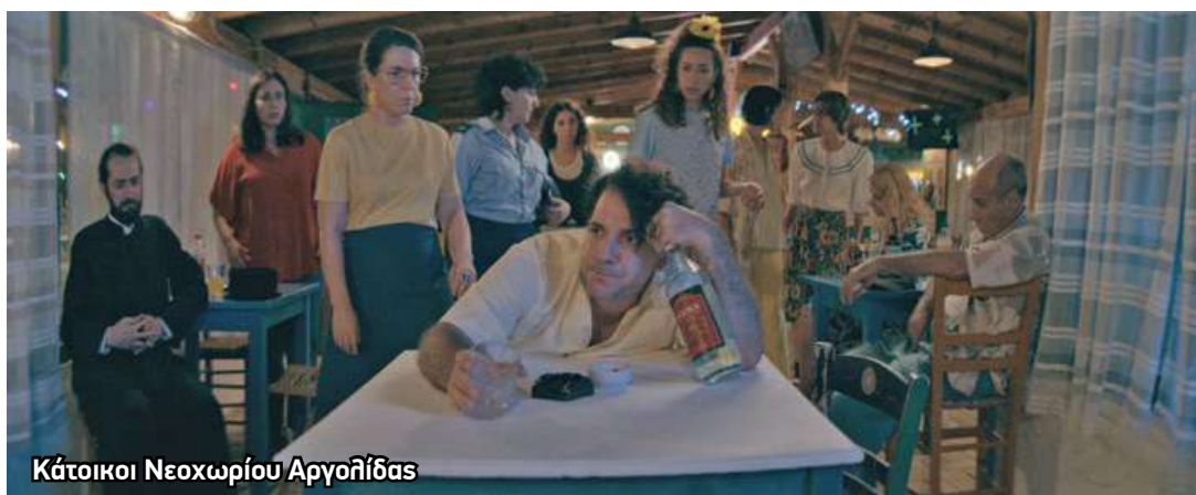
Κάτοικοι Νεοχωρίου Αργολίδας

66 Ο Παναγιώτης Ιωσηφέλης προσφέρει το έργο του στους φοιτητές του μεταπτυχιακού προγράμματος «Δημιουργική Γραφή, Θέατρο και Πολιτιστικές Βιομηχανίες» που πραγματοποιείται στο Τμήμα Θεατρικών Σπουδών του Πανεπιστημίου Πελοποννήσου, στο Ναύπλιο