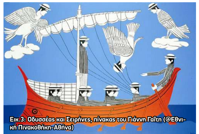
Εικ.3: Οδυσσεύς και Σειρήνες, πίνακας του Γιάννη Γαίτη (@Εθνική Πινακοθήκη-Αθήνα)