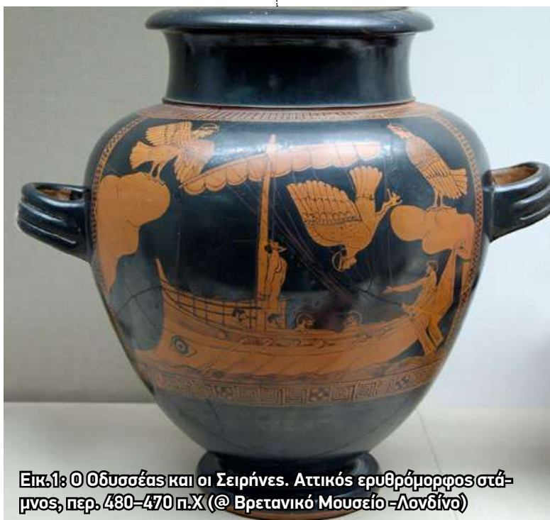
Εικ.1: Ο Οδυσσεύς και οι Σειρήνες. Αττικός ερυθρόμορφος στάμνος, περ. 480-470 π.Χ.