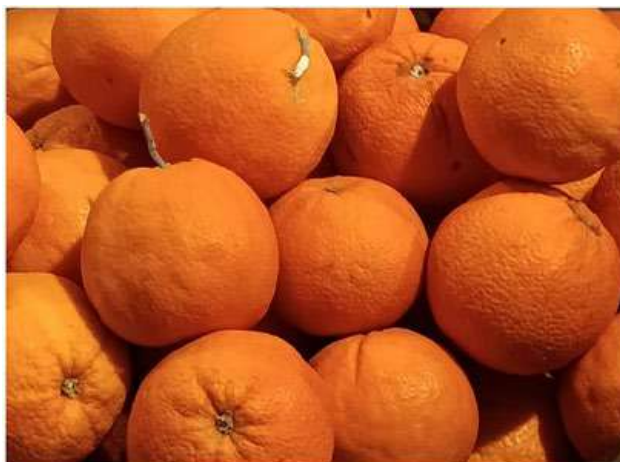
Το καλό πορτοκάλι ο κλαδούχος το τρώει

-Ναι πατέρα, ξέρω την υπαρξιακή σου άποψη. Είμαστε δέσμοι της νευροφυσιολογίας των αισθήσεων, αυτό που αντιλαμβανόμαστε ως πραγματικό είναι μια ψεύτικη εικό-