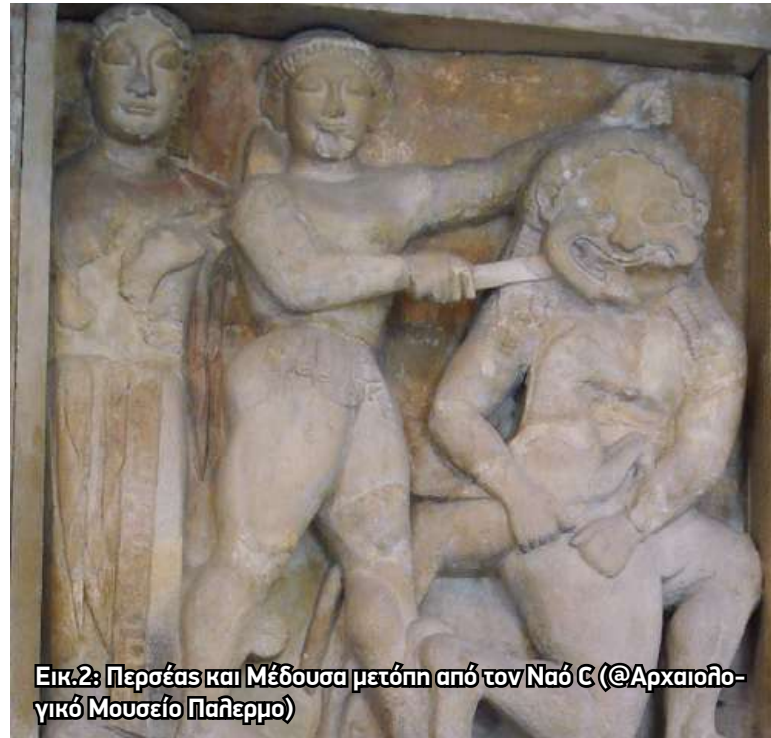
Εικ.2: Περσέας και Μέδουσα μετόπη από τον Ναό C (@Αρχαιολογικό Μουσείο Παλλερμο)

Στην αττική κεραμική του 5ου αιώνα π.Χ., οι Σειρήνες εμφανίζονται συχνά πάνω σε τύμβους ή επιτύμβιες στήλες. Παίζουν λύρα ή αυλό, σκύβουν πένθιμα, συνοδεύουν τον νεκρό. Η λειτουργία τους αλλάζει. Δεν είναι πλέον θανατοφόρες γοπεύτριες αλλά διαμεσολαβήτριες ανάμεσα στον κόσμο των ζωντανών και των νεκρών. Το τραγούδι τους γίνεται φορέας μνή-