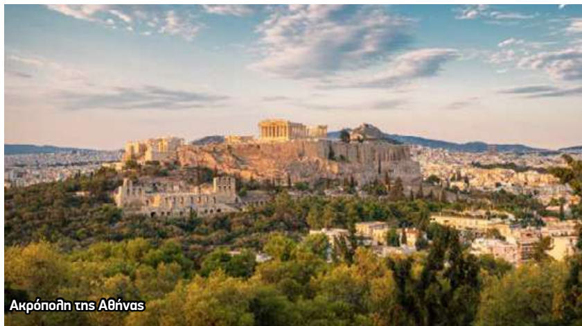
Ακρόπολη της Αθήνας

Η Μήλος, νησί των Κυκλάδων με δωρική καταγωγή και ιστορικούς δεσμούς με τη Σπάρτη, είχε επιλέξει να παραμείνει ουδέτερη. Η επιλογή αυτή, αν και συμβατή με το παραδοσιακό διακρατικό