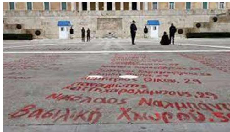
Μνημείο των επώνυμα δολοφονηθέντων