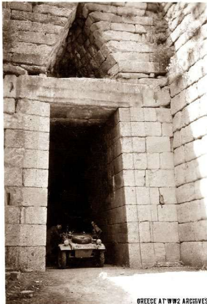
GREECE AT WW2 ARCHIVES

*Ο Κωνσταντίνος Χαρ. Τζιαμπάσος είναι αρχαιολόγος