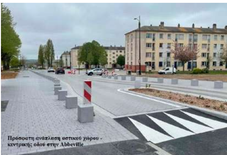
Προσφατη ανάπλαση αστικού χώρου - κεντρικής οδού στην Abbeville