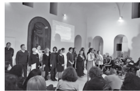
Το ΔΣ της Πύλης Πολιτισμού

Ιδιαίτερα την τελευταία περίοδο, η Πύλη Πολιτισμού πιστή στην ιδέα της διάχυσης των πολιτισμικών αγαθών στους συμπολίτες, ενεργοποιεί πρόσωπα και δυνατότητες σε μια ποιοτική πολιτιστική παραγωγή που βρίσκει ανταπόκριση σε όλο και περισσότερους πολίτες, ενισχύοντας έτσι το έργο της αλλά και το κοινωνικό της προφίλ. Η κοινωνική συμμετοχή και οι διεθνείς συνεργασίες της, ιδιαίτερα με τη Συλλογικότητα του Μονπελιέ, αποτελούν την επιβράβευση αυτής της παρουσίας και μας γεμίζει με αισιοδοξία και δύναμη για το μέλλον.