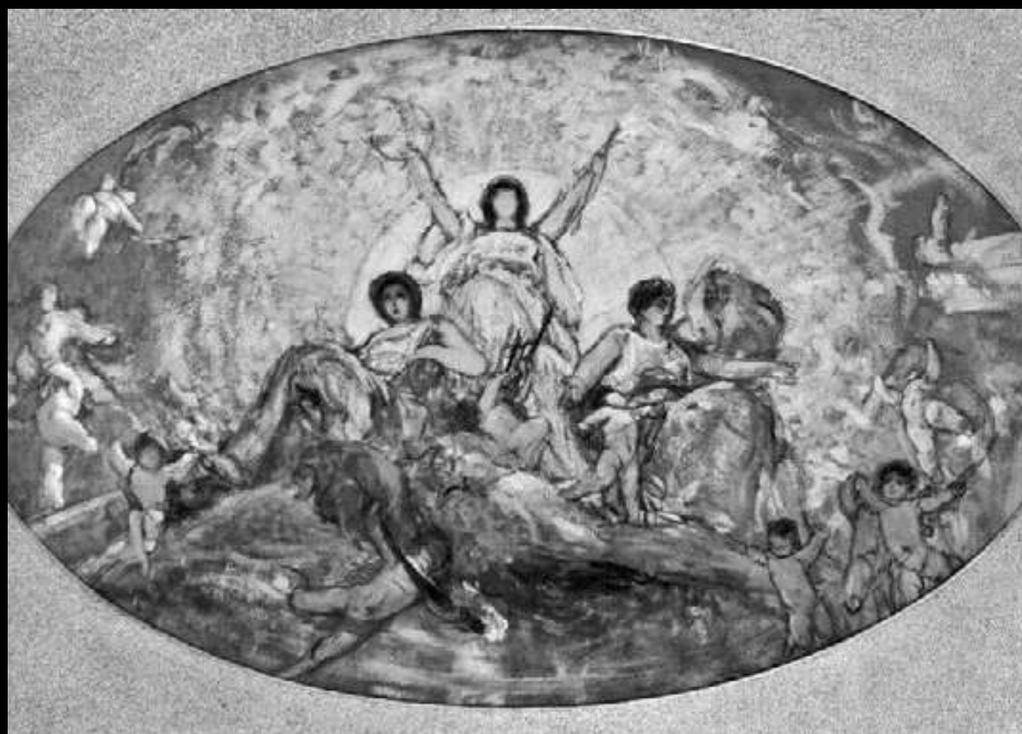
Το σύνολο των έργων τέχνης προέρχεται από τις συλλογές της Εθνικής Πινακοθήκης – Μουσείου Αλεξάνδρου Σούτσου και του Ιδρύματος Ε. Κουτλίδη, και περιλαμβάνει έργα των καλλιτεχνών:

Η έκθεση στοχεύει παράλληλα, μέσω των εκπαιδευτικών προγραμμάτων που θα υλοποιηθούν, στην αποκωδικοποίηση των συμβόλων που περιέχονται στα έργα τέχνης με μυθολογικό περιεχόμενο, και στην αναζήτηση των αξιών και των μηνυμάτων που μεταφέρουν σε εμάς σήμερα.