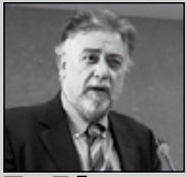
Του Γιάννη Πανούση, καθηγητή Εγκληματολογίας στο Πανεπιστήμιο Αθηνών

«Δεν μπορείς να συλλάβεις έναν άνθρωπο επειδή κάποιος τον δείχνει με το δάκτυλό του»