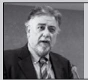
Του Γιάννη Πανούση, καθηγητή Εγκληματολογίας στο Πανεπιστήμιο Αθηνών

«Δεν μπορείς να συλλάβεις έναν άνθρωπο επειδή κάποιος τον δείχνει με το δάκτυλό του»