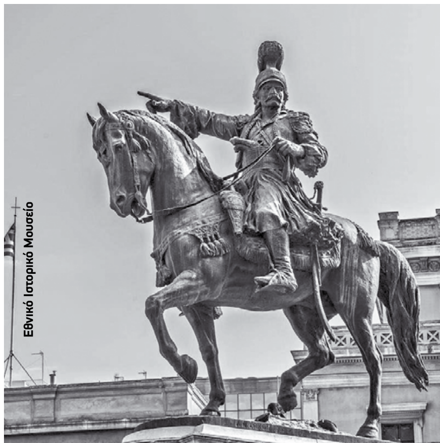
Εθνικό Ιστορικό Μουσείο

περί τα 15 χρόνια και υπηρέτησε στον Αγγλικό στρατό 6 χρόνια και τα υπόλοιπα χρόνια ως κρεοπώλης. Εκεί έστειλε τον γιό του Πάνο και σπούδασε στην Ιόνιο Ακαδημία της Κέρκυρας. Αυτός ήταν ο σοφός της οικογένειας. Εκείνη την περίοδο μέλημα του ήταν να βοηθάει πάντα τους Πελοποννήσιους πρόσφυγες, που του ζητούσαν βοήθεια. Ο Κολοκοτρώνης για να έχει πολλούς συγγενείς και φίλους πιστούς, εβάπτιζε τα παιδιά τους και τα ονόμαζε Θεωδωρή. Δεν έβαζε άλλο όνομα. Αν το παιδί ήταν κορίτσι, τότε το ονόμαζε Θεωδώρα. Έλεγε στους γιους του, νύμφη να μην πάρουν να την λέγουν Θεωδώρα, καθώς και τα κορίτσια να μην παντρεύονται άνδρα με όνομα Θεωδωρή, για να διαφυλαχθεί η θρησκευτική παραγγελία. Λίγους μήνες αργότερα τον Αύγουστο του 1820 ασθένησε και πέθανε η λατρευτή του σύζυγος Αικατερίνη και την έθαψαν όπως είχε ζητήσει η ίδια στο προαύλιο της ίδιας εκκλησίας. Πρωτοχρονιά του 1821 ο Θεόδωρος Κολοκοτρώνης βρίσκεται στην Ζάκυνθο. Έχει ήδη πάρει την μεγάλη απόφαση και περνάει με τους δικούς του τις γιορτινές μέρες.