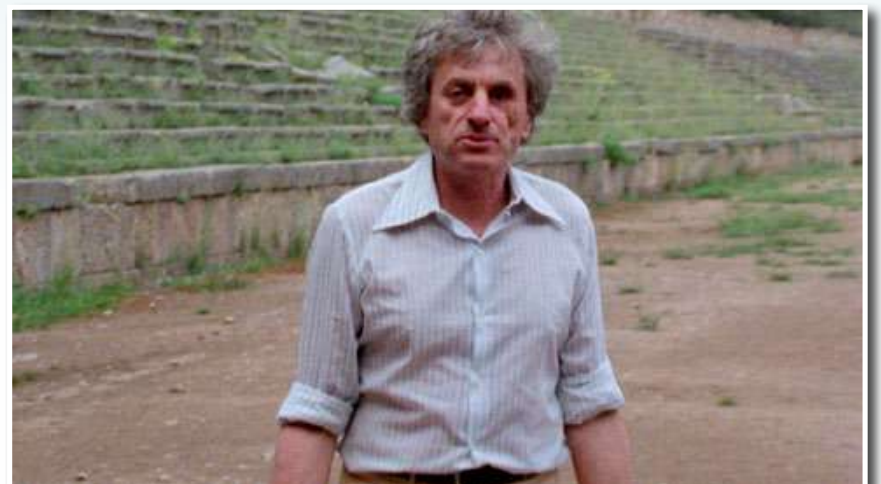
Ο Ιάννης Ξενάκης ήταν ένας από τους σημαντικότερους Έλληνες συνθέτες και αρχιτέκτονες του 20ού αιώνα, διεθνώς γνωστός ως Iannis Xenakis