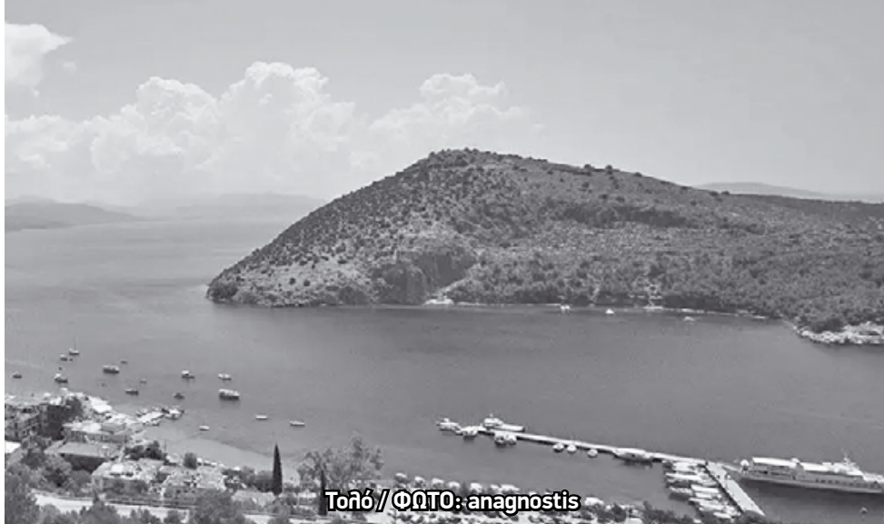
Τολό // ΦΩΤΟ: anagnostis