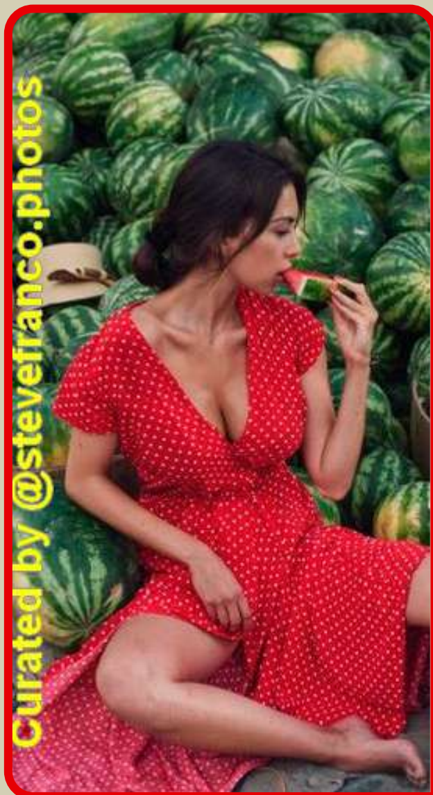
Το Καλοκαίρι από τα φρούτα φαίνεται

(Το ανέκδοτο αυτό το υπέβαλε στο διαγωνισμό ο Geoff Anandappa από το Μπλάκπουλ).