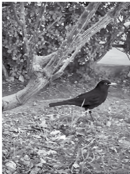
ΑΣ ΦΟΡΑΓΕ ΤΣΟΥΡΑΠΙΑ

-Καλωσόρισε στην οικογένειά μας, θα την έχω σαν κόρη μου.