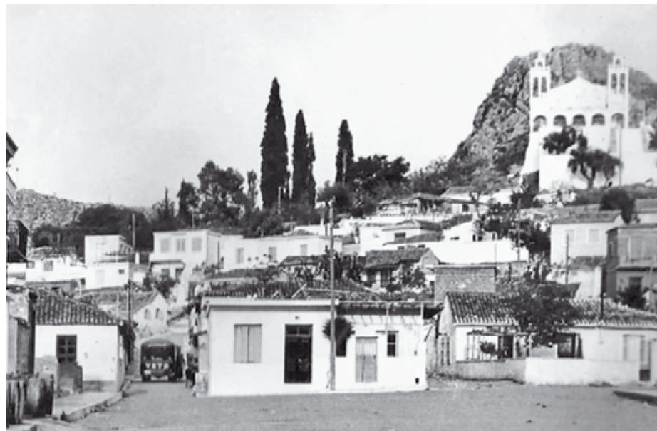
Η Πρόνοια Ναυπλίου τα «Κρητικά»

Από τους 545 «ενδεείς» Κρήτες εγκαταστάθηκε στο Άργος, τον Σεπτέμβριο του 1824, τα 2/3 προέρχονταν από τη δυτική Κρήτη και το 1/3 από την ανατολική όπου με παραστάσεις τους προς το Βουλευτικό πέτυχαν την ικανοποίηση των αιτημάτων τους (σεγαστικό, σιτηρέσιο, συμμετοχή τους στα Κοινά). Η κατάστασή τους ήταν δυσχερής και οι ελληνικές επαναστατικές αρχές κατέβαλλαν