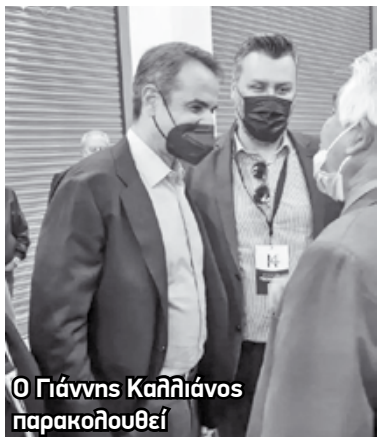
Ο Γιάννης Καλλιάνος παρακολουθεί