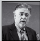
Του Πάνου Πανούση, καθηγητή Εγκληματολογίας στο Πανεπιστήμιο Αθηνών

«Δεν μπορείς να συλλάβεις έναν άνθρωπο επειδή κάποιος τον δείχνει με το δάκτυλό του»