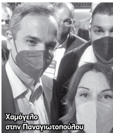
Χαμόγελο στην Παναγιωτοπούλου