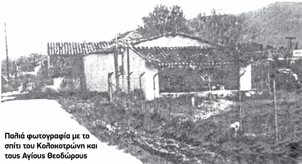
Παλιά φωτογραφία με το σπίτι του Κολοκοτρώνη και τους Αγίους Θεοδώρους

Επιθυμία του Γέρου του Μοριά ήταν να ταφεί στο σκηνώμα του σ' αυτό το χώρο, σ' Ανάπλι,