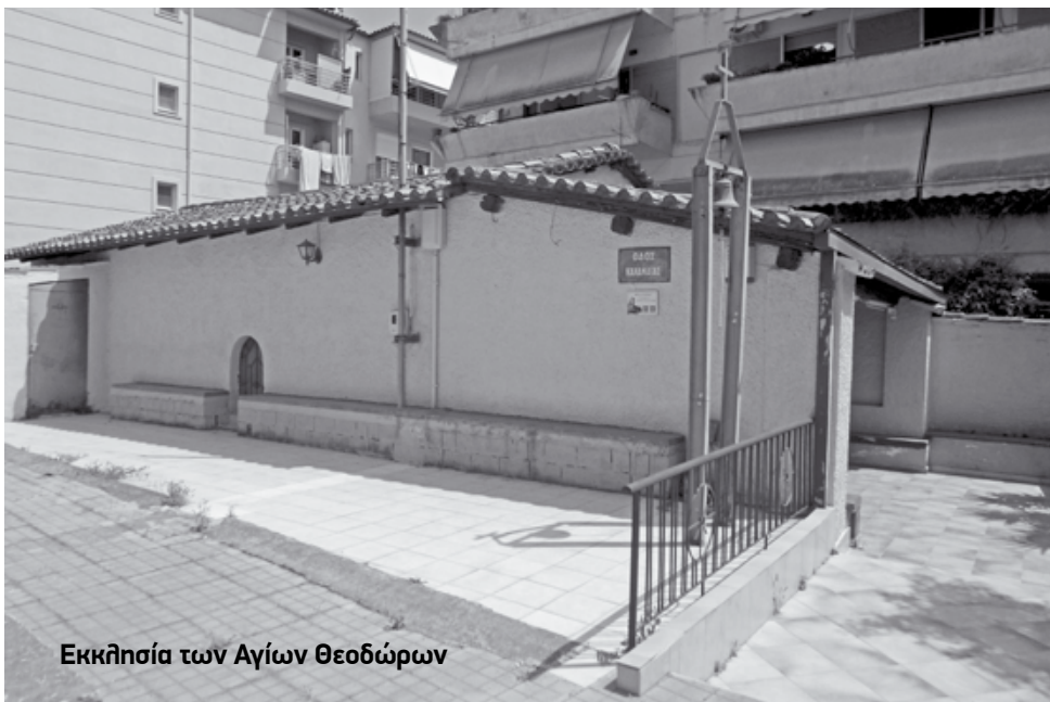
Εκκλησία των Αγίων Θεοδώρων

Αλλά και όπως χαρακτηριστικά αναφέρει ο Κων/νος Οικονόμου στον εκφωνηθέντα επι-