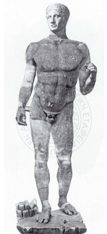
Εικ.3: Ο Δορυφόρος του Πολύκλειτου, [ρωμαϊκό αντίγραφο από την αρχαία Μεσσήνη]

Πρόκειται για ένα από τα πρώιμα παραδείγματα του κλασικού όρου «contrapposto». Σαν τεχνική εισήχθη στη γλυπτική με το περίφημο έργο «Το παιδί του Κριτία», το οποίο σήμανε ταυτόχρονα και την έναρξη της Κλασικής περιόδου στην τέχνη. Αφήνοντας πίσω τις στάσιμες μορφές των κούρων και των κορών, η γλυπτική περνάει σε μια νέα φάση όπου η ρεαλιστική αποτύπωση του ανθρώπινου σώματος, με τις σωστές και αρμονικές αναλογίες και την ανάλογη μιμήτικη διάπλαση, συναντά το ανθρωπιστικό ιδεώδες της καλοκαγαθίας, δηλαδή του σωματικού και ψυχικού κάλλους. Επίσης θα μπορούσε να ειπωθεί ότι το έργο, αυτό, σταθμός για την εξέλιξη της γλυπτικής, φέρει όλα τα τυπικά χαρακτηριστικά της ώριμης κλασικής περιόδου. Πέρα από τα τεχνικά, δηλαδή τις μαθηματικές αναλογίες, το