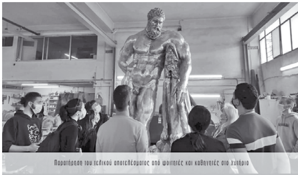
Παρατήρηση του ειδικού αποπελάσματος από φοιτητές και καθηγητές στο χυτήριο

Δεν άργησε να έρθει η απάντηση του Δημήτρη Καμπόσου, ο οποίος μέσω του δημοτικού του συνδυασμού αναφέρει: «Ο Ηρακλής είναι το μεγαλύτερο brand παγκοσμίως και η δημοτική αρχή με την τοποθέτηση αυτού του εκθέματος, αλλά και των πολεμιστών του