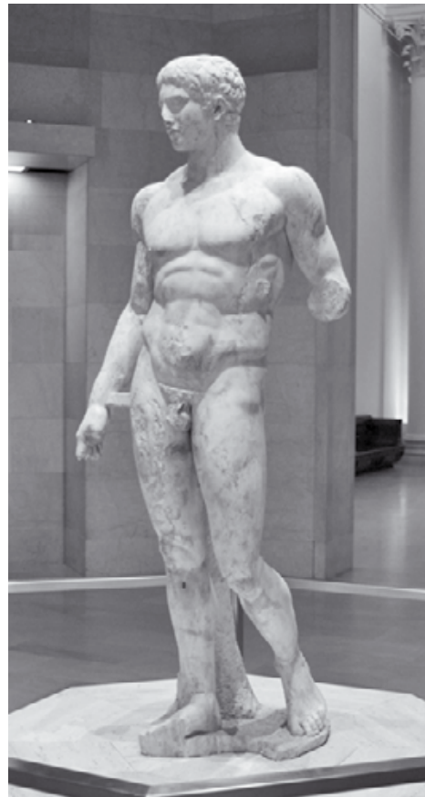
Εικ.2: Ο Δορυφόρος του Πολύκλειτου [Ρωμαϊκό αντίγραφο από την αρχαία πόλη Stabiae (Castellum di Stabia), εκτίθεται στο Minnesota Museum of Art]

άνδρα που φαινομενικά κρατάει δόρυ, εξού και η ονομασία Δορυφόρος. Η στάση του σώματος του είναι ζυγισμένη. Η δεξιά πλευρά, δηλαδή τα δεξιά άκρα, φαίνεται ότι είναι στάσιμα και «σκληρά». Αντιθέτως, η αριστερή πλευρά αναδεικνύει μια κίνηση αλλά ταυτόχρονα και μια άνεση. Για αυτό το λόγο, η αριστερή πλευρά ονομάζεται άνετο σκέλος στο οποίο παρατηρείται λυγισμένο το γόνατο, η κνήμη πηγαίνει προς τα πίσω και λίγο πλάγια και οι άκρες των δακτύλων πατούν στο έδαφος. Επίσης σημαντικό είναι ότι και η λεκάνη έχει μια τάση να πηγαίνει προς την πλευρά του άνετου σκέλους ενώ οι ώμοι έχουν αντίθετη κλίση. Αν παρατηρήσει κανείς με προσοχή το έργο αυτό, θα διαπιστώσει ότι όλα τα μέλη του σώματος έχουν διαφορετική διάρθρωση. Σε αυτό το σημείο καλούμαστε να εξηγήσουμε το γιατί. Γιατί ο καλλιτέχνης επέλεξε να δημιουργήσει ένα άγαλμα βασιζόμενος σε αυτή την τεχνική; Ο Πολύκλειτος, όπως έχει αναφερθεί ήδη παραπάνω, ήταν διάσημος για την φιλοτεχνία αγαλμάτων που απεικόνιζαν αθλητές. Το αθλητικό ιδεώδες της εποχής εκφραζόταν πλήρως στα σώματα αυτά, καθώς και άλλα χαρακτηριστικά όπως η ανδρεία, το θάρρος και η ομορφιά. Ο καλλιτέχνης επεδίωκε να αποδώσει με αρμονικό τρόπο την ανατομία του σώματος, γεγονός που τον ανέδειξε ως ένα άριστο γλύπτη. Είχε πλήρη γνώση και αντίληψη της ανθρώπινης ανατομίας και μιμήτικη διάπλαση. Για παράδειγμα, στον Δο-