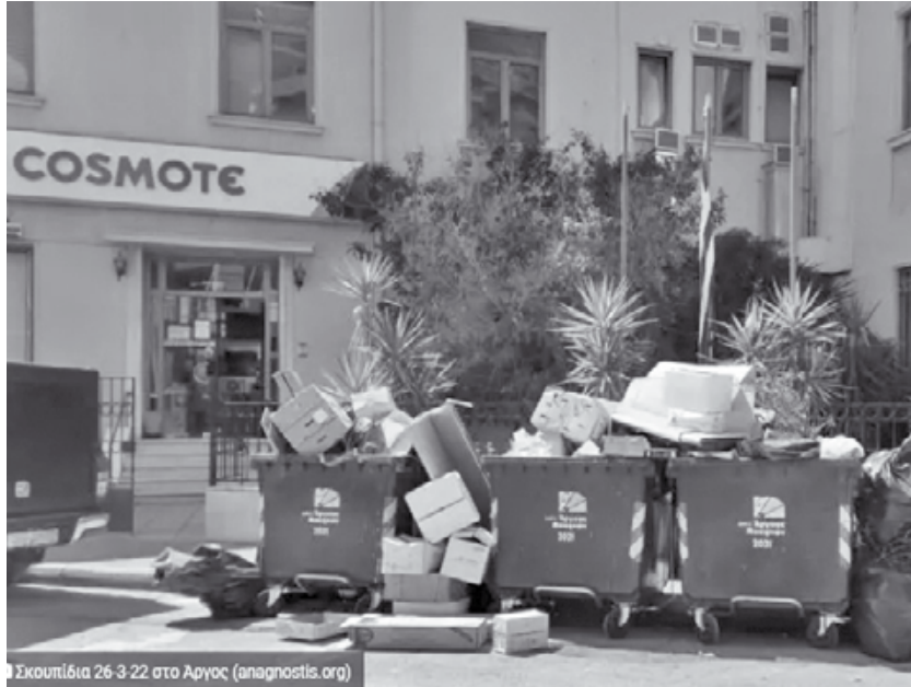
Σκουπίδια 26-3-22 στο Άργος