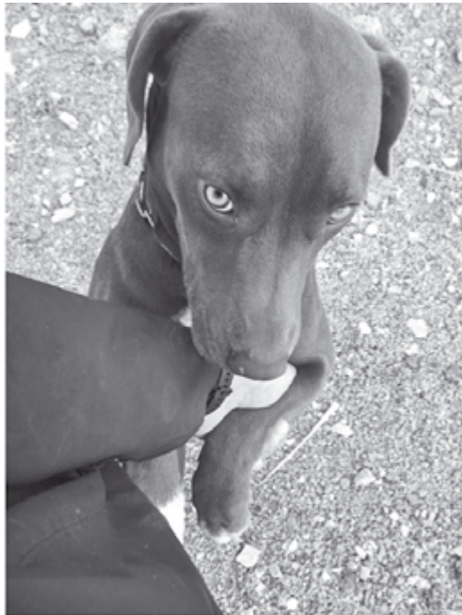
Σαράντα μύγες ο Μπαλιούσης...

Του έδωσε ένα τσαπί, του είπε να σκάψει ένα μικρό κομμάτι γης και μετά να ρίξει τους σπόρους. Πιο πολύ έσκαψε ο σκύλος με τα πόδια του παρά ο γιος. Τους περισσότερους σπόρους τους έφαγε το τσοπανόσκυλο για