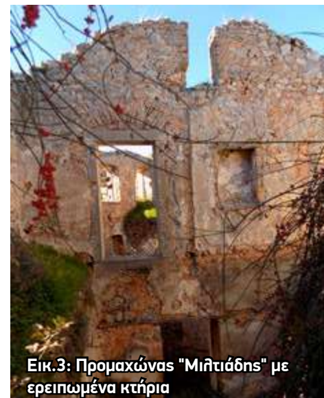
Εικ.3: Προμαχώνας "Μιλιτιάδης" με ερειπωμένα κτίρια

Επίσης εδώ πρέπει να επισημάνουμε για μία ακόμα φορά ότι στον εξωτερικό χώρο του φρουρίου, στο Παλαμήδι,