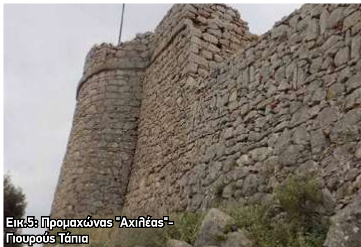
Εικ.5: Προμαχώνας "Αχιλλέας"- Γιουρούς Τάπια