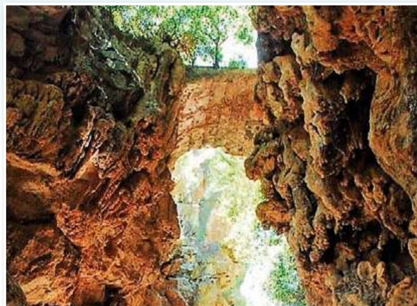
Φτιαγμένο να ενώνει δύο κόσμους. Έναν άνυδρο και ένα καταπράσινο από βλάστηση