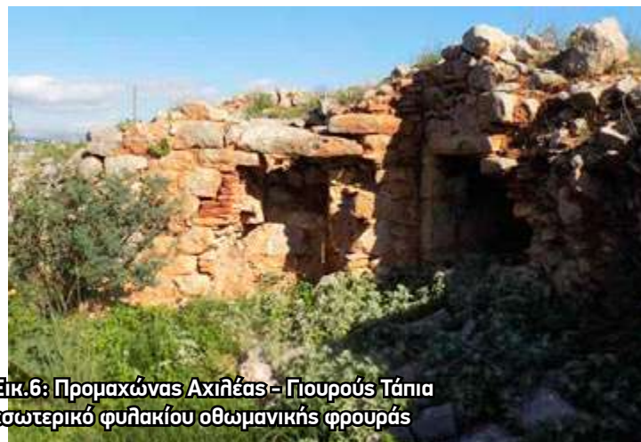
Εικ.6: Προμαχώνας Αχιλλέας- Γιουρούς Τάπια εσωτερικό φυλακείου οθωμανικής φρουράς