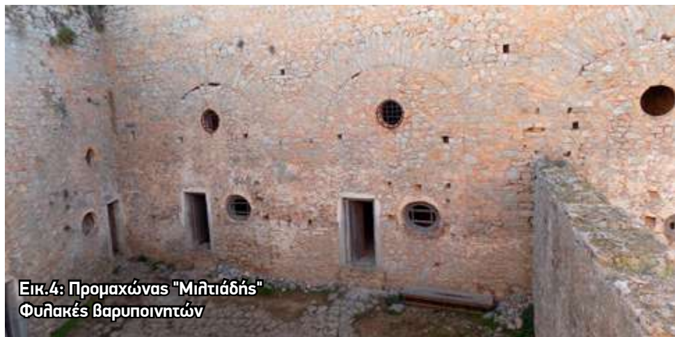
Εικ.4: Προμαχώνας "Μιλιτιάδης" Φυλακές βαραιοποινιτών

πλίου, τα ισχυρά κάστρα και το ασφαλές λιμάνι. Αλλά το χλιοτραγουδισμένο Παλαμήδι, «Το Παλαμήδι τ'όμορφο θεός να το φυλάει», είναι συνδεδεμένο και με τα τραγικά γεγονότα του εμφυλίου πολέμου και του αλληλοσπαραγμού. Εδώ φυλακίσθηκε και ο αρχιστράτηγος της Ελληνικής Επανάστασης Θ. Κολοκοτρώνης, από το καθεστώς της Αντιβασιλείας, και ο προμαχώνας του Μιλιτιάδη λειτουργήσε για ένα αιώνα περίπου ως φυλακή βαραιοποινιτών μέσα σε άθλιες συνθήκες, και τις εκτελέσεις της μιστικής καρμανιόλας. «Αντιλαλούν οι φυλακές τ' Ανάπλι κι ο Γεντικουλές».