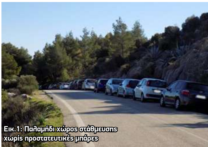
Εικ.1: Παλαμήδι χωρίς προστατευτικές μπάρες

Η Ελληνική Επανάσταση απέκτησε στέρεα ερείσματα στην Πελοπόννησο με την μοναδική στρατηγική θέση του Ναυ-