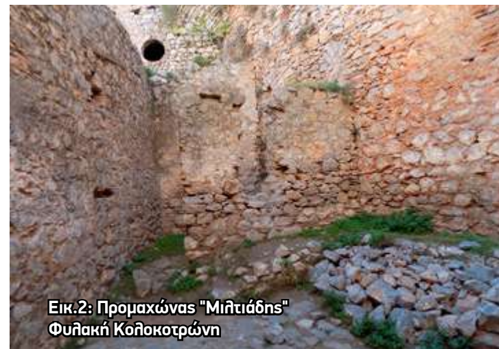
Εικ.2: Προμαχώνας "Μιλιτιάδης" Φυλακή Κολοκοτρώνη